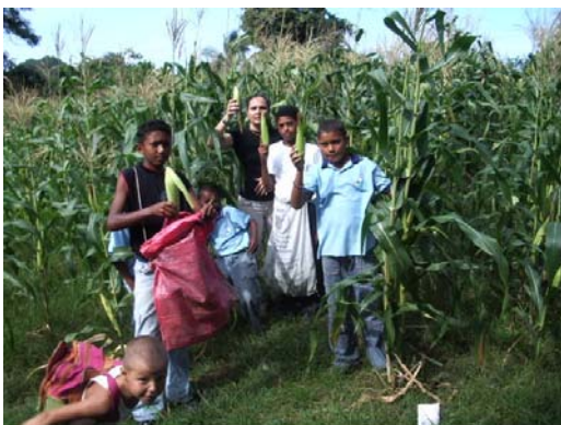
Cueillette du maïs sur le terrain de l'école

Sur le terrain de l'école Mosquito, la récolte du maïs, de l'aubergine et de l'oignon est bonne! Ces légumes serviront à l'approvisionnement de la cantine. Le maïs sera servi en grain, ou moulu pour en faire une farine. Les aubergines et les oignons accompagneront les plats présentés aux enfants. Actuellement 1000 repas équilibrés sont servis par semaine aux 200 enfants de l'école de Mosquito. La cantine est gérée par un groupe de mères de famille de la communauté, avec la participation d'une jeune ONG colombienne « Fondation amour pour l'humanité ». Dans une optique d'autosuffisance de la cantine, l'excédent de la récolte sera vendu au marché local et les profits serviront à acheter les légumes qui ne peuvent pousser dans cette terre, par exemple, les carottes et les pommes de terre.