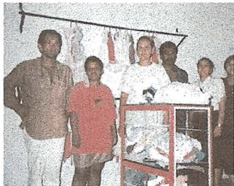
Le ropero est géré par le comité féminin de l'Association des réfugiés du quartier

Ce projet vise le développement durable, la génération d'emplois et de revenus ainsi que la formation dans le domaine de la confection et la réparation de vêtement.