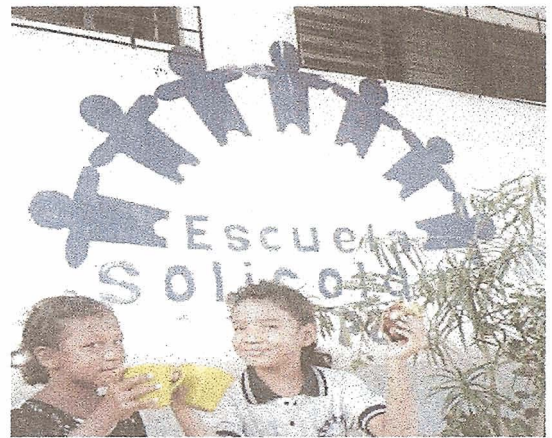
École Solicolque, quartier La Paz, Santa Marta

C'est surtout dans la commune 8 de Santa Marta que viennent se réfugier, depuis une vingtaine d'années, des milliers de familles paysannes déplacées. Située au pied de la Sierra Nevada, la commune 8 est composée de plusieurs quartiers d'invasion, parmi lesquels La Paz, Cristo Rey et Circacia, où se réalisent la plupart de nos projets.